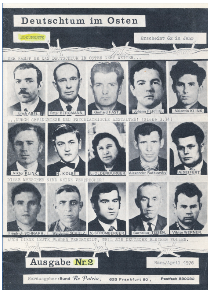
Der Umschlag der Zeitschrift "Re Patria" zeigt die Gesichter ausreisewilliger Russlanddeutscher, deren Freiheitsdrang weder Verhaftungen noch Einweisungen ins Straflager eindämmen konnten.

Besonders schlimm wirkten sich die germanophobe Regierungspolitik und die insgesamt deutschfeindliche Einstellung eines beträchtlichen Teils der russischen, ukrainischen und anderen Nachbarvölker aus.