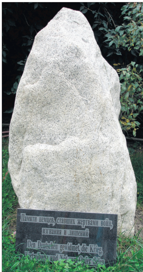
Gedenkstein vor dem "Deutschen Haus" in Almaty zum Gedenken an die russlanddeutschen Opfer der Repressalien und des Krieges. Er trägt die Aufschrift: "Памяти немцев, ставших жертвами войн, изгнания и лишений - Den Deutschen gewidmet, die Krieg, Vertreibung und Not zum Opfer fielen."

Das Dienst- und Arbeitsethos (russ. трудовая этика, служба, служение) durchdringt die russlanddeutsche Geschichte, ganz gleich ob man als Staatsmann oder