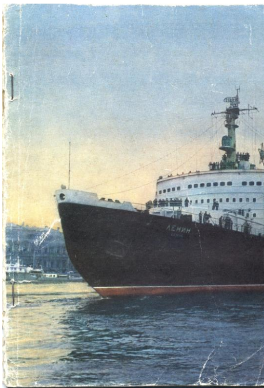
Обложка гектографической брошюры с материалами 2-й делегации российских немцев, июнь-июль 1965. Для маскировки выбран патриотический сюжет – атомный ледокол «Ленин».